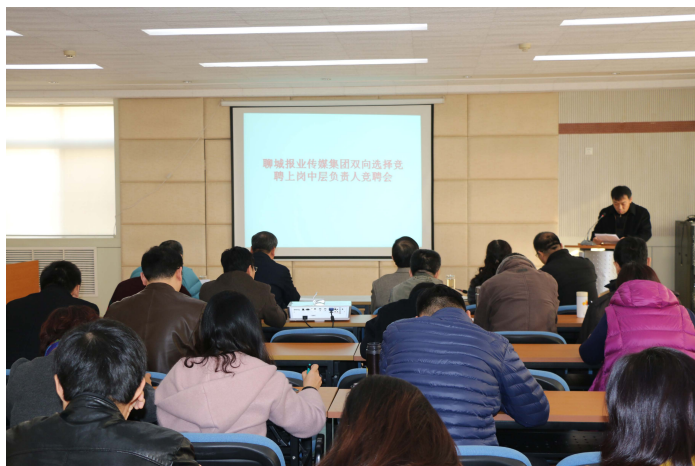
聊城报业传媒集团双向选择竞聘上岗中层负责人竞聘会。

——坚持把服务挺在前面，广告经营逆势上升。按照习近平总书记“广告宣传讲导向、报业经营需创新”的指示精神，我们认识到，报业经营下滑，既有经营环境变化的影响，又有传统媒体服务意识、手段、能力落后的原因，所以我们坚持“把服务挺在前面”作为全体员工的行动准则，通过提高客户体验完美度，以专业的策划服务发掘客户的需求，撬动新的利润增长模式和增长点；完善服务手段，拉长服务链条，想客户之所想，急客户之所急，满足客户的多种宣传需求，注重宣传更注重宣传效果；实行精细化管理，开源节流，逐行业逐部门分析市场需求，针对策、采、编、印、发环节存在的问题，逐项理顺解决。通过“两提高”、“六强化”和机制体制创新，营造“放胆干事、放手干事、放心干事”的经营环境，形成集团上下“一盘棋”思想，激发团队整体活力，提高员工工作的主动性和创造性。按照聊城日报广告经营目标管理办法，2017年广告经营任务在2016年的基础上增加15%，一季度超额完成了任务计划。