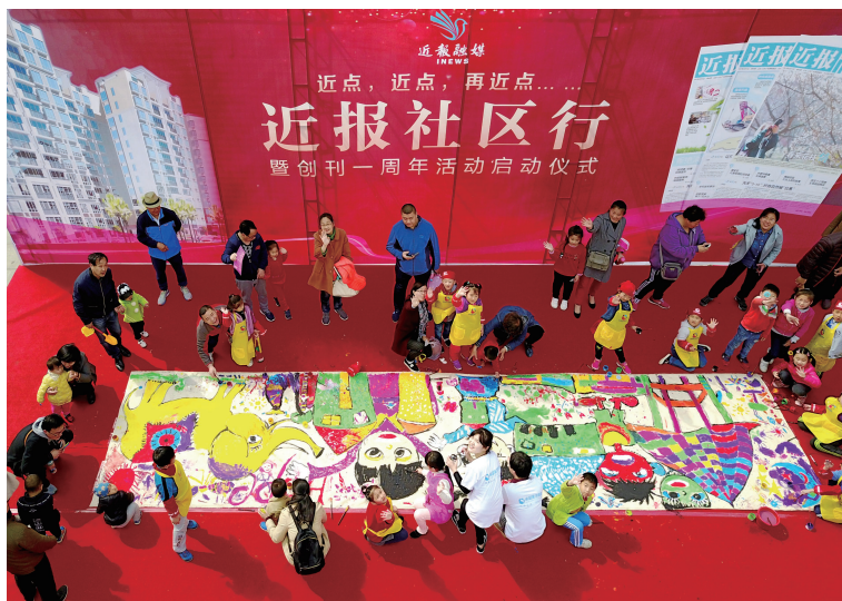
2017年4月9日，“近报社区行”暨创刊一周年活动在济南举行。