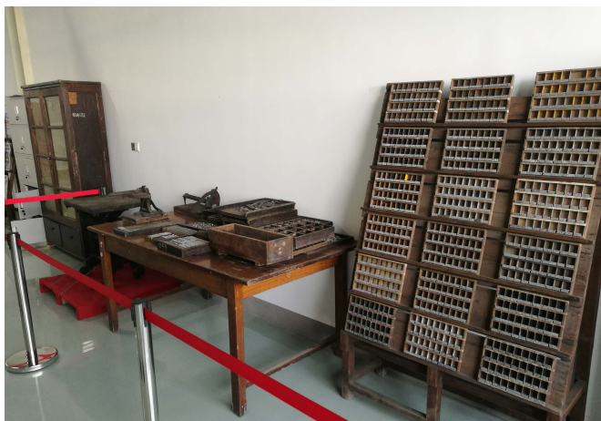
印刷体验馆内的铅活字印刷展示。

据悉，按照规划，青报印刷体验馆将进一步挖掘报业印刷文化，丰富藏品层次和体验科目，力争打造出一个特色鲜明、品质高端的报业印刷教育基地。