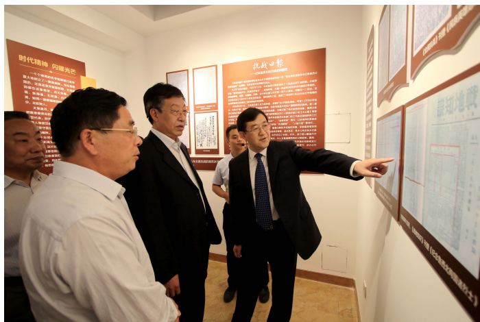
2016年10月1日，聊城日报新闻博物馆开馆。

“供给侧改革”是目前社会各界关注的焦点，新闻生产同样也面临着供给侧改革。在经历信息传播浮躁喧嚣之后，大众对主流媒体的信任感正在回归，优质内容成为传统媒体的“压舱石”和安身立命的根本，如何创作出更多反映时代精神、群众喜闻乐见的新闻作品，提升党报公信力和影响力，是新闻媒体人面临的主要任务。2016年以来，聊城报业传媒集团围绕中心、服务大局，把握正确舆论导向，遵循新闻传播规律，在坚持“守正”的基础上力求“出新”，努力实现党性原则和新闻规律的统一。