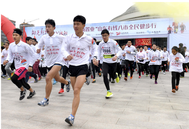
2016年10月29日，八城市彩跑活动在临沂市正式启动。

在以后的日子里，近报要从立足贴心需求、提供极致服务、打造特色风格、传播知识以及融合发展上下功夫，一方面，离我们的读者“近点，近点，再近点”，另一方面，也离近报的成功“近点，近点，再近点”。