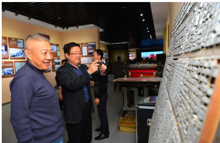
大众日报社报史陈列馆中的传统印刷展示。

社史陈列馆展厅呈L型布局，陈展面积约530平方米，展线长度约170米。遵从现代风格的建筑布局，陈展以内环中心电梯的公共空间中心入口为起始，沿从左至右的